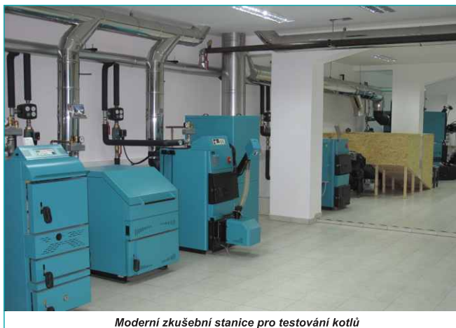
Moderní zkušební stanice pro testování kotlů

Produkty firmy Centrometal d.o.o. jsou plně testovány a certifikovány jak v souladu s chorvatskými i evropskými normami a směrnicemi, tak dle zákonných požadavků platných v Chorvatské republice a na jiných trzích, kde je společnost zastoupena. Testování vývojového a výrobního procesu je prováděno v našich vlastních zkušebních laboratořích v souladu s normami stanovenými dle našich systémů jakosti. Testování modelů a finálních výrobků je prováděno také nezávislými institucemi v Chorvatsku, v celé Evropě i mimo ni.